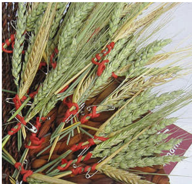
Ährensträußchen für jeden Gast