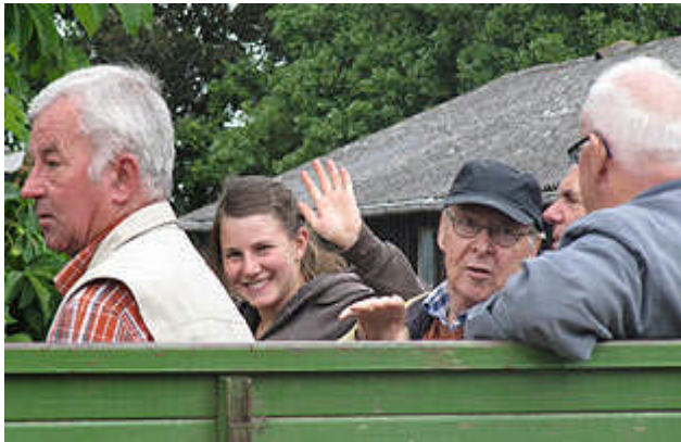
Die Felderrundfahrt geht los