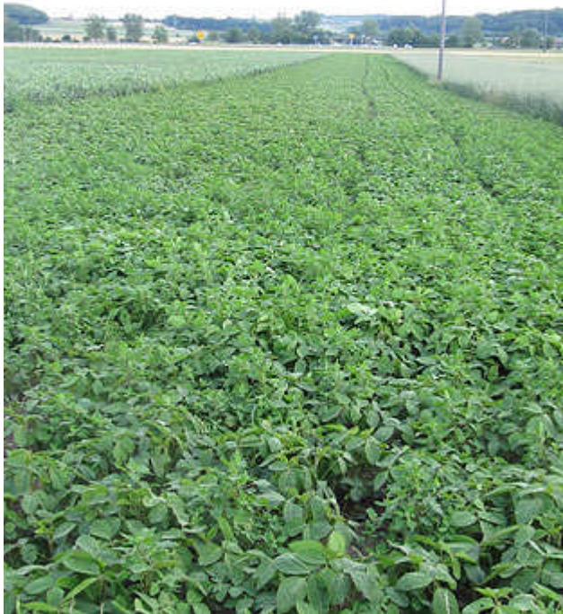
Das ist unser Feld mit Sojabohnen