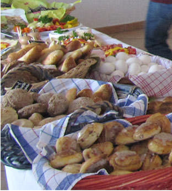
Leckeres am Buffet