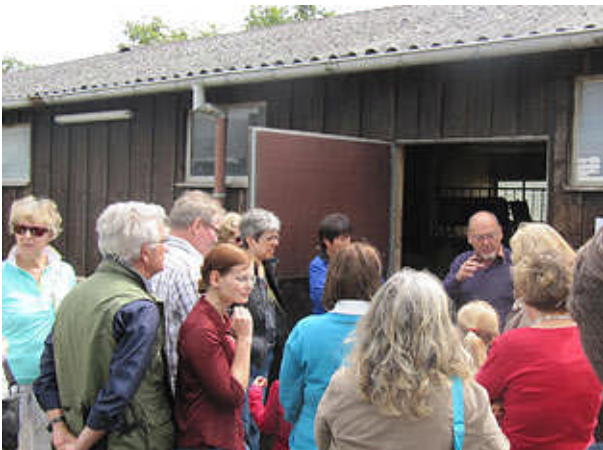
Großes Interesse an der Hofführung