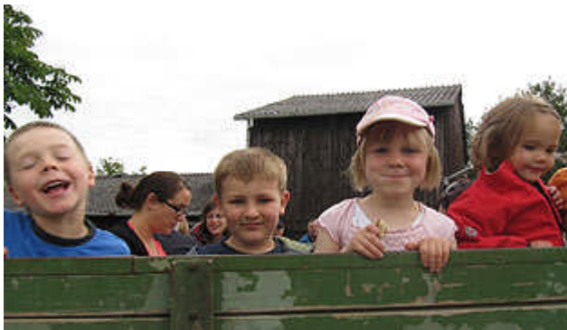
Auch die Kleinen haben ihren Spaß